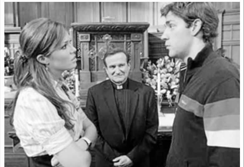
Escena de 'Hasta que el cura nos separe' que emite La 1.

dable sorpresa cuando, al llegar allí para conseguir la bendición del padre Frank, este no se la da hasta que no superen su famoso e infalible curso de preparación matrimonial. El reverendo, para comprobar si los jóvenes se aman realmente, somete a la pareja a duras y extravagantes pruebas. La relación de la pareja se pondrá patas arriba, que es lo que pretende el padre Frank para saber si en un futuro serán capaces de seguir unidos.